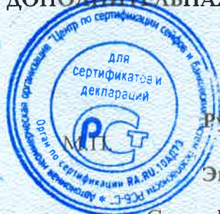
Схема сертификации - 3